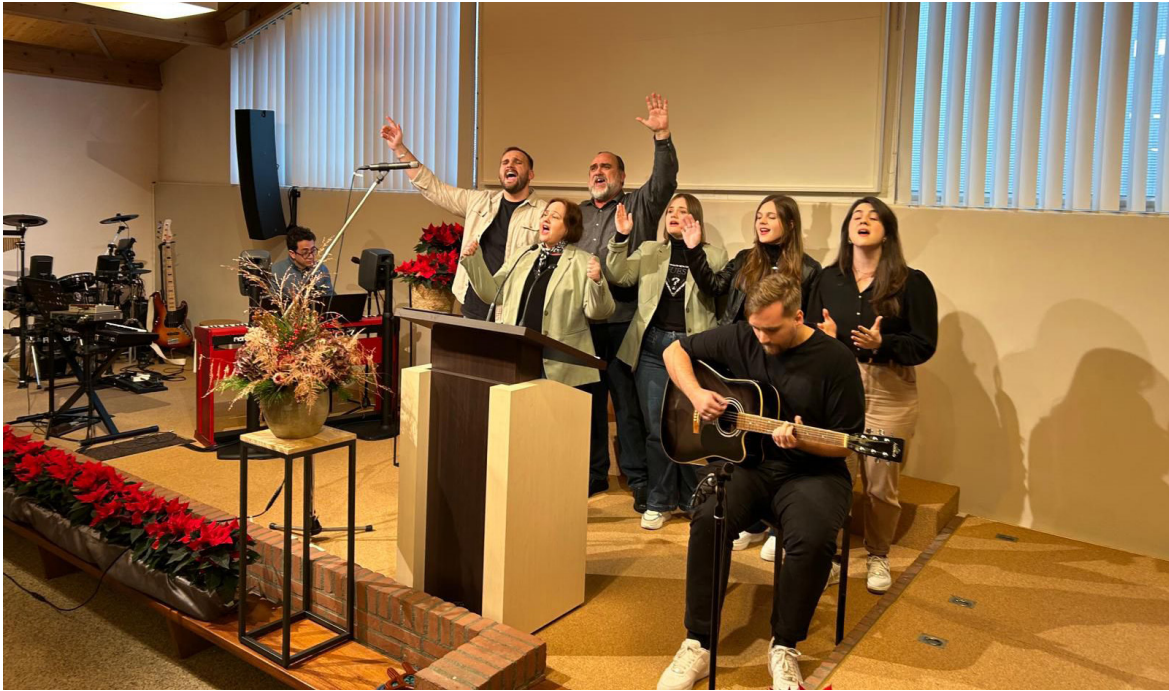
Foto: Gezin tijdens de zondagdienst in Nederland

© Stichting PBB 2025 pinksterbijbelschool.nl